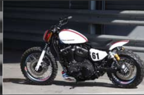
Ein echter Eyecatcher im...