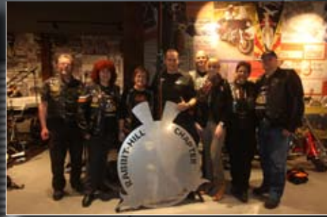
Rabbit Hill Chapter Präsent