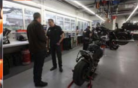
Führung durch die Werkstatt