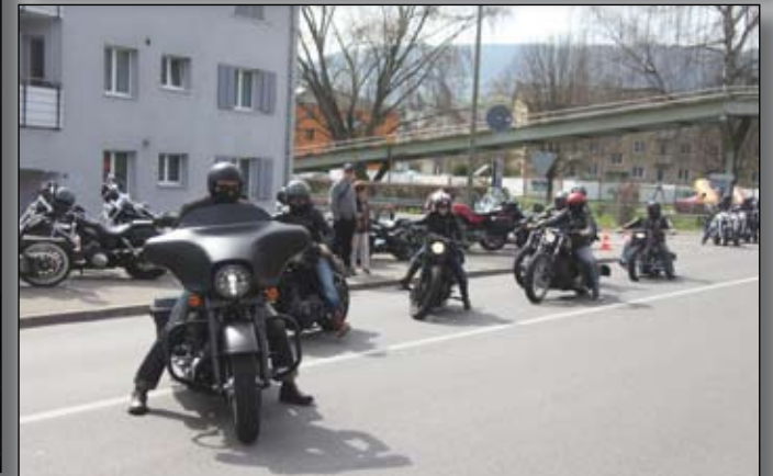
ALLE BILDER: Impressionen vom „Grand Opening“ des Harley-Heaven. Volles Haus an beiden Tagen des Wochenendes war garantiert und bei herrlichem Frühlingserwetter trafen die meisten Besucher auf zwei Rädern ein.