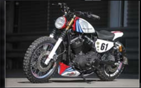
...klassischen Martini Racedesign!