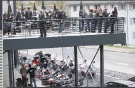
HOG-Andrang auf dem Balkon