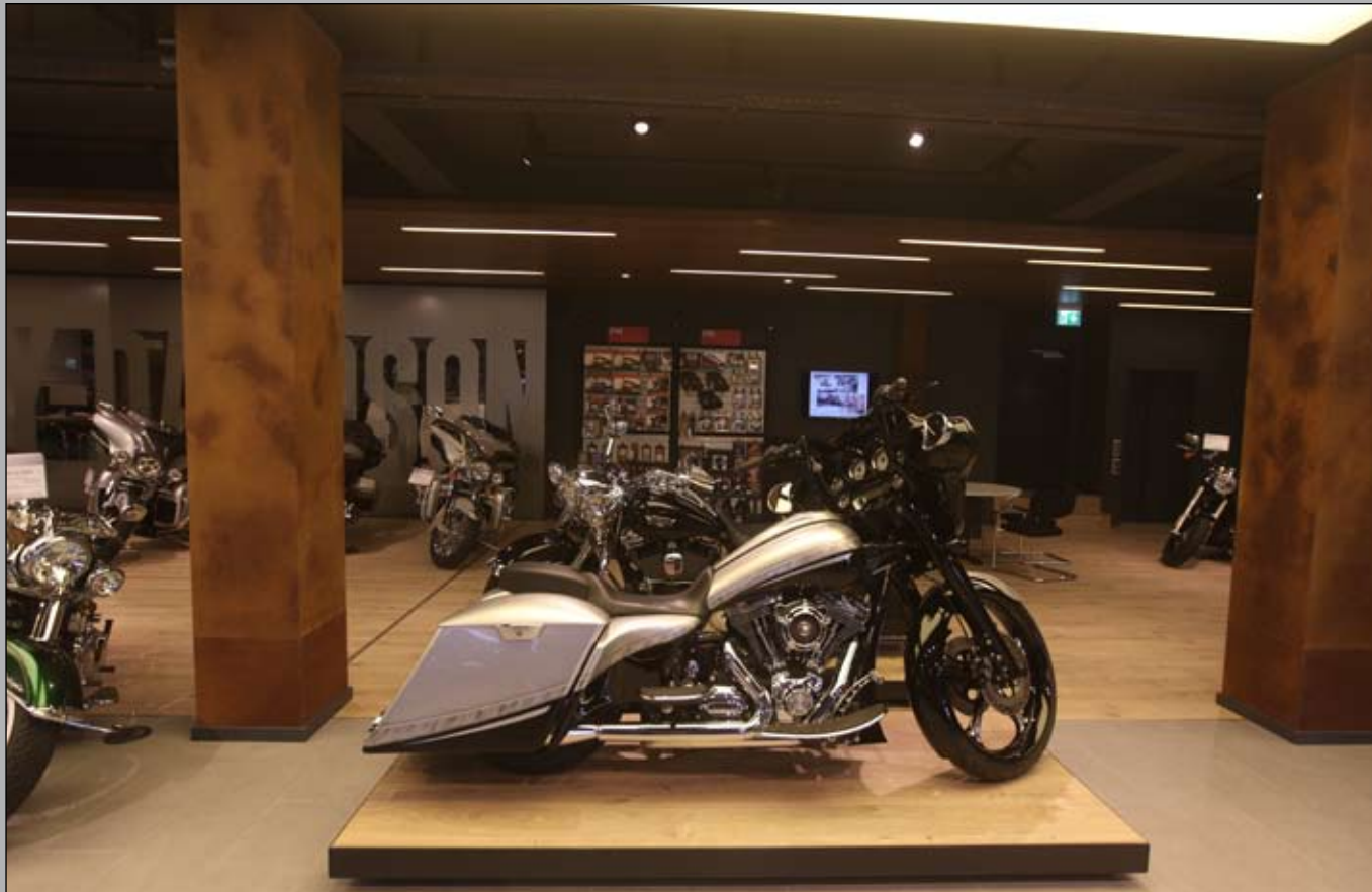
TOP: Der große Showroom für die Bikes im Erdgeschoß präsentiert die Serienmaschinen aus Milwaukee, aber auch ausgewählte Top-Customs aus dem Hause Bächli, für die man oft Teile aus Europa oder der Schweiz homologiert hat. Wie diesen, mit Jim Nasi Komponenten aufgebauten, Bagger.