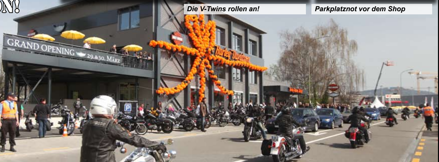
Showtime vor der Terrasse