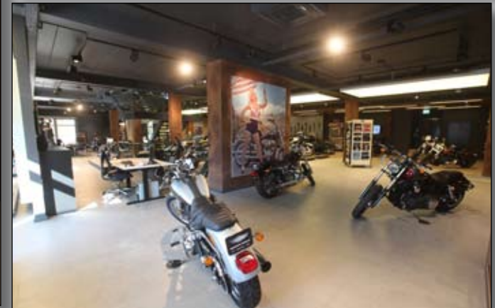
OBE: Teilansicht Fashion Store mit der Zentralkasse. UNTE: Teilansicht des Showrooms, noch nicht komplett mit Bikes bestückt.

am Samstag sowie den „Black Barons“ und „7t Cover“ am Sonntag.