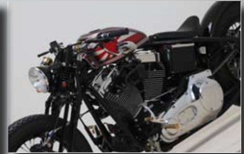
...und niedrige Sitzposition