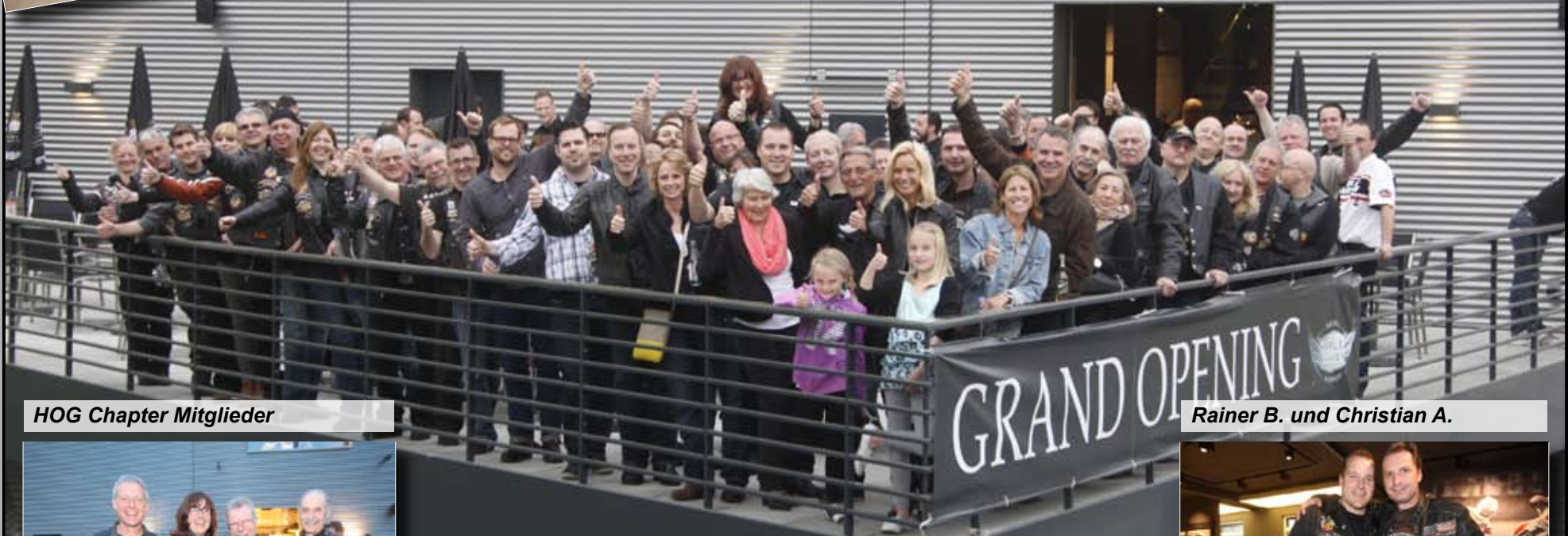
HOG Chapter Mitglieder