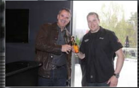
Ein Bächli Bier darf sein!